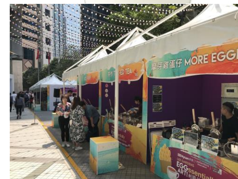
圖為參考以實際為主