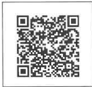
團體報名表單下載