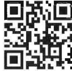
說明 一 之 2