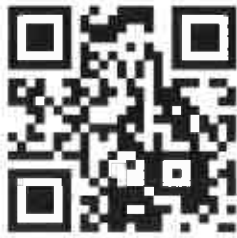
說明 一 之 1