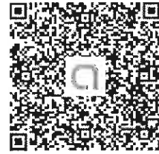
line 社群「臺中市都審線上申請系統」

(三) 若有任何疑問，歡迎加入 line 社群「臺中市都審線上申請系統」，於社群中詢問系統相關問題！請掃瞄 QRCode 加入社群！加入名稱以【單位名稱+姓名】