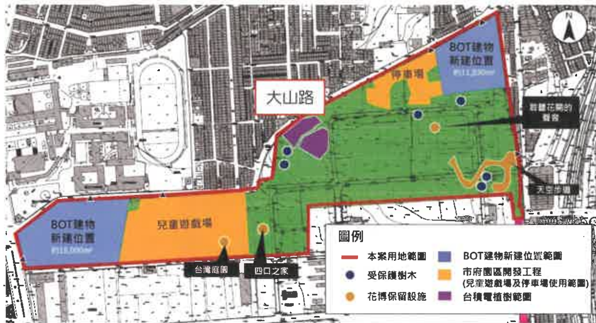
圖 1 后里森林公園 BOT 建物新建位置使用範圍示意圖