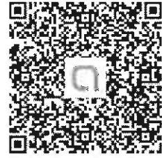
line 社群「臺中市都審線上申請系統」

(三)若有任何疑問，歡迎加入 line 社群「臺中市都審線上申請系統」，於社群中詢問系統相關問題！請掃瞄 QRCode 加入社群！加入名稱以【單位名稱+姓名】