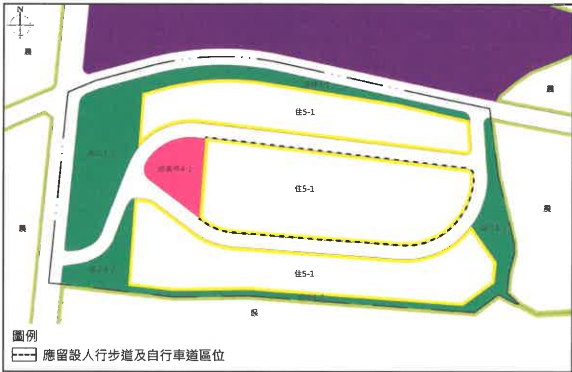
圖 6-7-1 通盤檢討後住宅區留設人行步道及自行車道區位示意圖