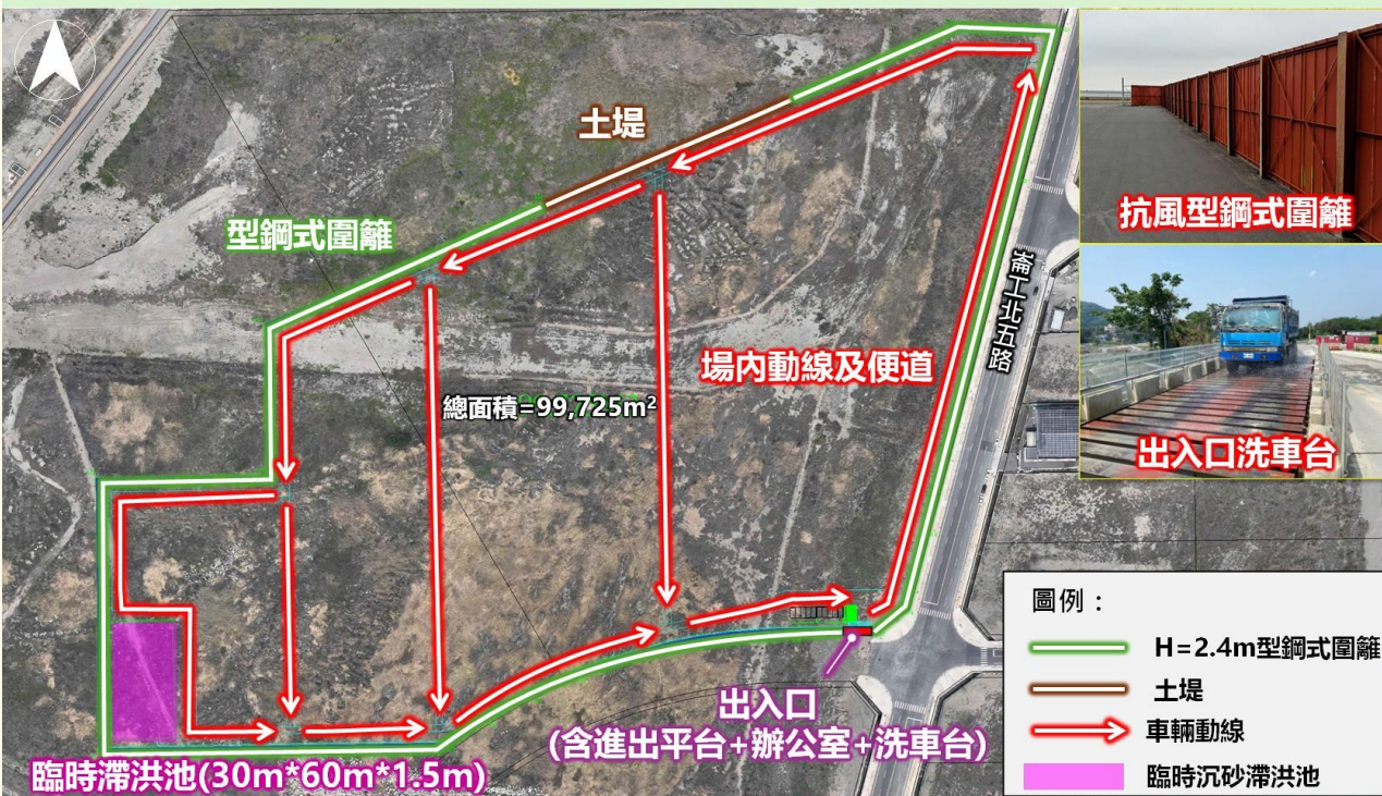
彰濱產業園區崙尾土方暫置區-平面配置圖

因受限人力及出入口，避免車輛大排長龍，造成司機等候過久造成民怨，預計5月收土前會再召開說明會，告知實際運作模式，管控每日收土數量及車次