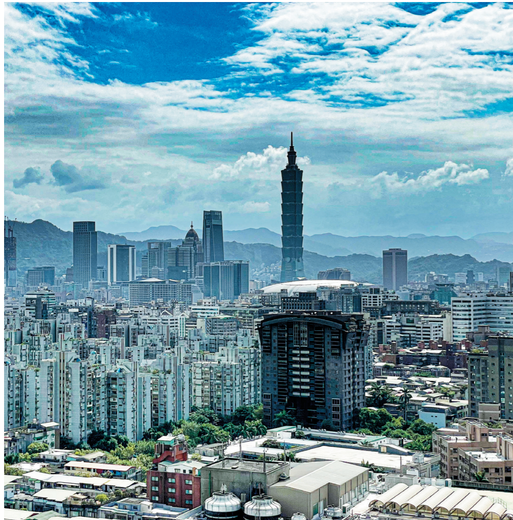
圖 / 台北 101 大樓

在台灣一棟建築的生命週期大致為三、五十年，隨著危老重建與都市更新的政策推動下逐步翻整；雖然看起來是個十分漫長又緩慢的進程，但實際上城市的天際線是會隨著時間的滾動而改變。由於工作的關係，時常需要在各式的建築中穿梭，每當有機會一定會登高望遠，好好欣賞並觀察當地的天際線，並且將其紀錄下來，作為自己對這座城市景觀的觀察與變化紀錄。