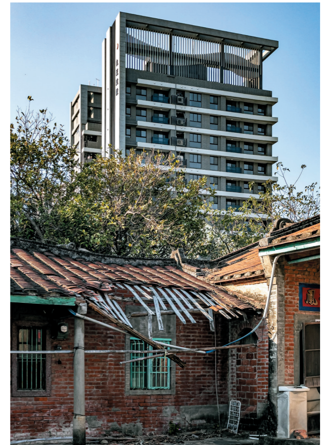
圖 / 攝於新竹高鐵新區一代，當地正積極地開發與新建，具歷史代表性的三合院也因此而荒廢頹敗，其與身後的新建築顯現出強烈的對比。

而前陣子走訪台南時，意外發現在一棟商旅建築的背面，竟整齊地掛滿了分離式空調主機。不敢想像在炎熱的夏天裡，空調滿載運轉的時候產生多大的溫室效應影響；然而這樣的作法，又若有似無地驗證台灣人「差不多先生」的個性。