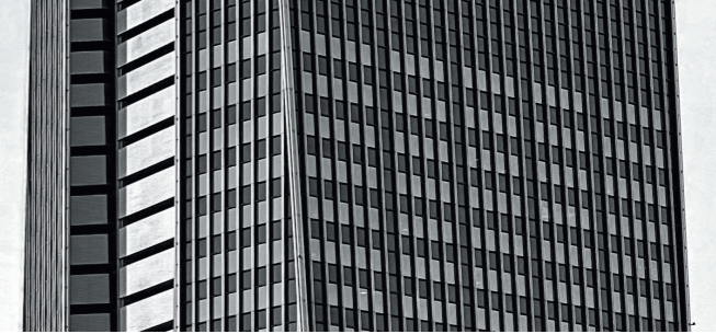
圖 / 台北南山廣場大樓

台北市中心的天際線一直都在不斷地變化，在 2017 年前只有台北 101 大樓一支獨秀，現在則多了台北南山廣場大樓相襯，改變了台北市的天際線，而它也正好是經筆者輔導取得綠建築認證的案例之一。