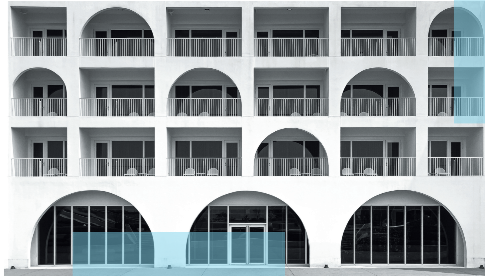
圖 / 因應不同風格、功能性的建築，時常可以看見各式的遮陽形式，而這些景致就潛藏在我們的生活當中，只有你是否曾留心觀察過。

而除了顯而易見的建築外觀，建築的本質是什麼呢？對筆者而言，它除了詮釋與體現設計者的美學概念以外，同時也包覆了人們的生活；因此可以藉由通過觀察建築的語彙細節來了解洞悉當地人們的生活風格與文化背景，這也是人人之所以喜歡旅行異地所帶來的文化衝擊體驗感受。