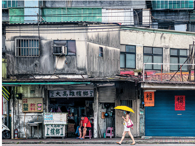
圖 / 畫面裡充滿了鐵皮浪板、招租字樣、檳榔攤販與雜亂的電線，似乎詮釋了台灣味？

例如下圖，還記得這裡是離市中心不遠的一處街景，上一個街口之前還是琳琅滿目的鋼骨構造的摩天大樓，一轉眼就變成鐵皮浪板所包覆的建築，搭配鐵捲門上斗大的招租字樣，使眼前的景致顯得格外冷清；而這樣高強度的街景反差，其實正訴說了區域性的經濟差異，而其中隱含更多的也許是許多市井小民難以言喻的苦。