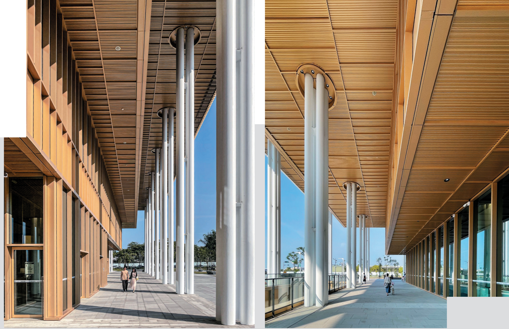
圖 / 臺南市立圖書館新總館