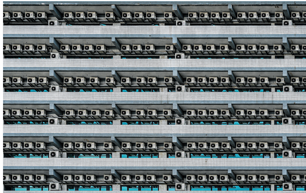
圖 / 整齊排列的室外機，實際上在運行時會造成熱氣短循環，大幅降低運轉效率。

而前陣子走訪台南時，意外發現在一棟商旅建築的背面，竟整齊地掛滿了分離式空調主機。不敢想像在炎熱的夏天裡，空調滿載運轉的時候產生多大的溫室效應影響；然而這樣的作法，又若有似無地驗證台灣人「差不多先生」的個性。