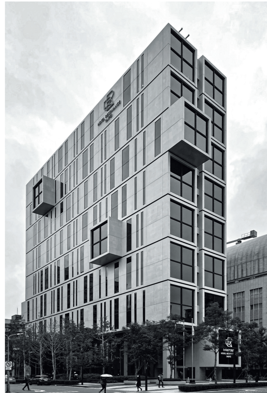
圖 / 台北時代寓所

此外，我也非常熱衷於觀察建築的立面設計，因為建築立面時常隱含了許多設計語彙、風格、歷史脈絡及元素，通過不同視角下的觀望並且細細品味，或多或少都能感受到設計者的巧思。舉例來說，座落於台北市權東路上的 YKK 台北總部，其建築外型正恰如其生產製造的產品—「拉鍊」，而一樓入口處的雨遮，除了原本遮風擋雨的功能性外，外型也如同拉鍊頭一般，完整了這棟建築的設計語彙，十分可愛。