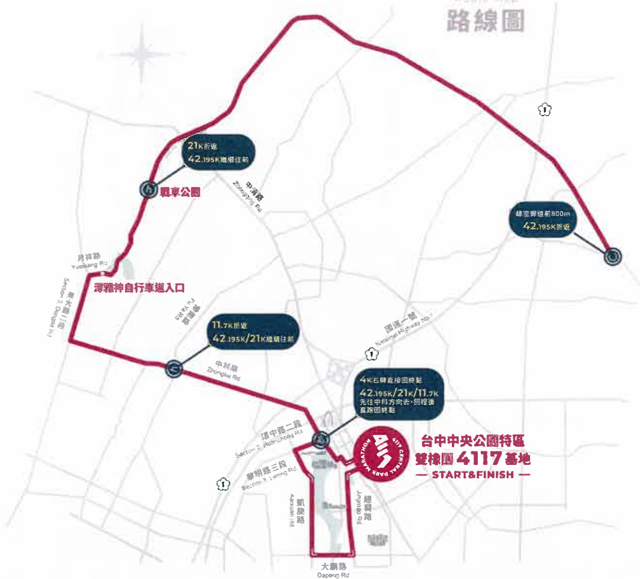
Route Map 路線圖

CENTRAL PARK MARATHON | 2023 4117 中央公園馬拉松